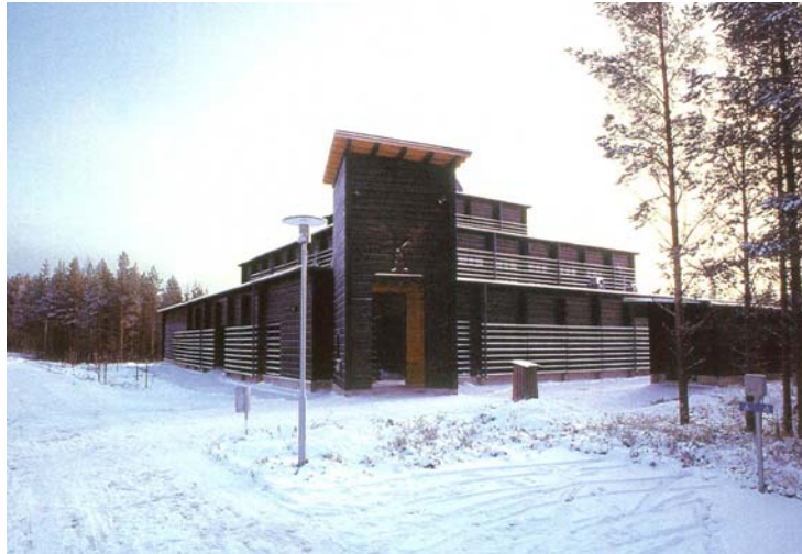
Kuva 6. Kierikki-keskus, Yli-Ii.

jossa on täydellisesti varustettu auditorio, ravintola ja esihistoriaan pohjautuviin käsityötuotteisiin erikoistunut myymälä (kuva 6). Alueella sijaitsee kivikauden kylä ja ansapolku, jotka antavat hyvän ja toiminnallisen kuvan elämästä 6000 vuoden takaa. Kierikkikeskus tarjoaa ryhmille, kouluille ja kokousvieraille erilaisia opastus- ja ohjelmalveluja.