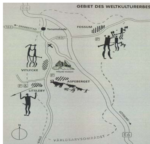
Kuva 2. Piirroskartta Unescon maailmanperintöalueesta Tanumissa.

Bohusin läänin pohjoisosassa sijaitsevaa Tanumia pidetään Ruotsista Norjaan ulottuvan kalliokaiverrusalueen sydämenä. Alueen tuhansista kaiverruksista suurin osa (n. 3500) sijaitsee Pohjanmeren rannikolla Bohusin läänissä. Tanumin noin 760 kalliopiiirrosta käsittävä alue on listattu vuonna 1994 UNESCO:n maailmanperintöluetteloon (kuva 2). Kunnan keskivaiheilla sijaitsevan Vitlycken noin 22 metriä leveän ja noin 300 piirroskuvasta ja noin 150 malja/kuppimerkistä muodostuvan kaiverrusalueen tuntumaan on rakennettu Vitlycken kalliopiirosmuseumo , josta käsin esitellään koko piirrosaluetta. Museo kuuluu hallinnollisesti Bohusin läänin museoon. Dagens Nyheter-lehti on listannut museon Ruotsin parhaaksi kulttuurihistorialliseksi museoksi v. 2001 ja se on suosittu matkailukohde.