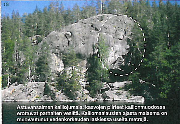
Astuvansalmen kalliojumala: kasvojen piirteet kalliionmuodossa erottuvat parhaiten vesiltä. Kalliomaalauksen ajasta maisema on muovautunut vedenkorkeuden laskiessa useita metrejä.

Kalliomaalaukset ovat viesti menneestä, tuhansien vuosien takaa. Jäljet kalliion pintaan on tehnyt kaltaisemme ihminen, valiten paikoiksi luonnon muovaamat jyhkeät kalliontörmät ja pystysuorat seinämät. Punertava väri on uhmannut ajan kulkua säilyen meidän päiviimme saakka. Mitä merkkejä meidän ajastamme mahtaa olla luettavissa 6000 vuoden kuluttua? Ja miten paljon on mahdollista ymmärtää muinaisten viestien merkityksistä? Lähdä kohtaamaan mennyt omin silmin ja jaloin. Patikoi samoille rannoille esi-isiemme kanssa!